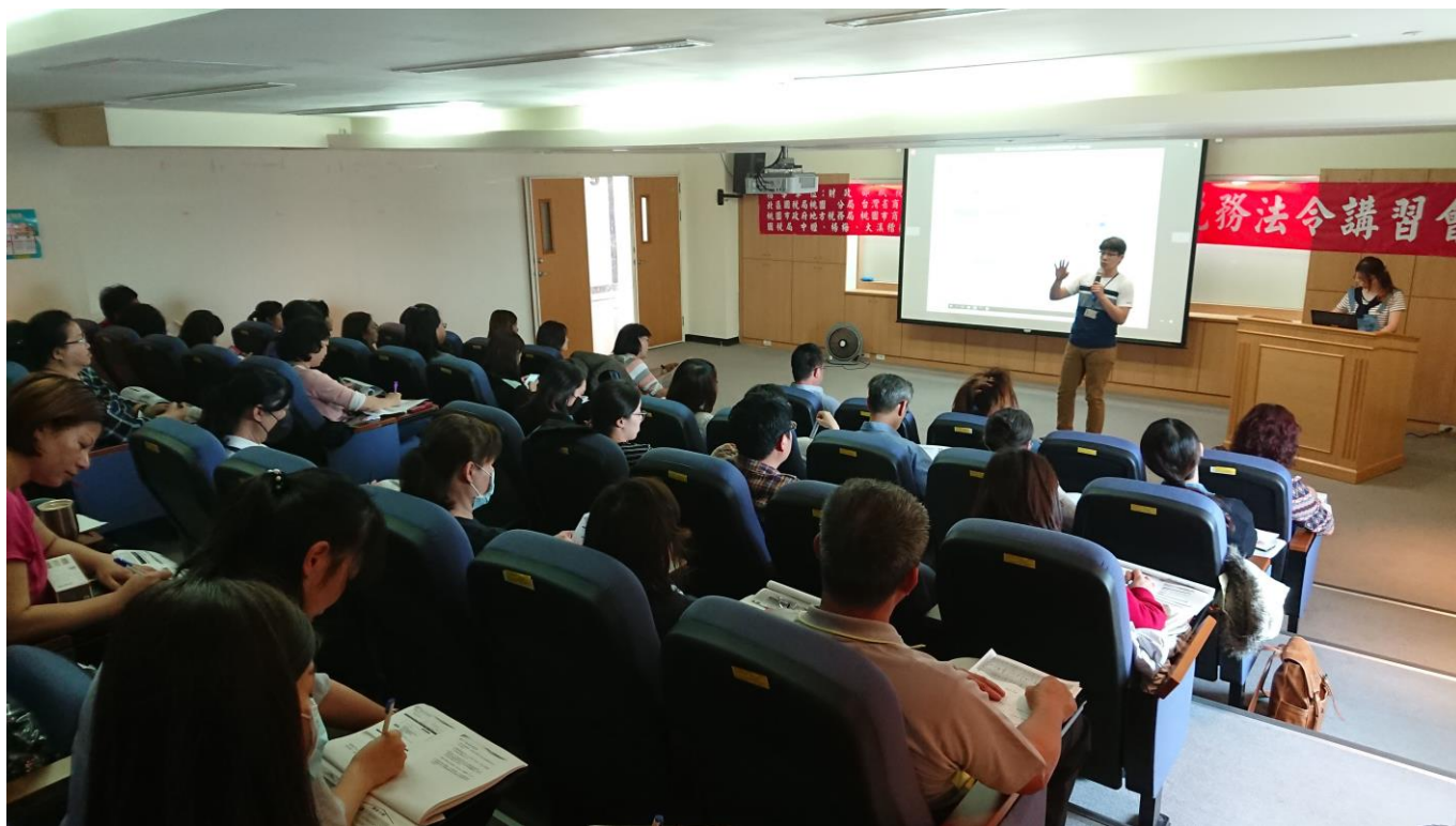
108年4月26日聯合稅務講習 學員專心聽講